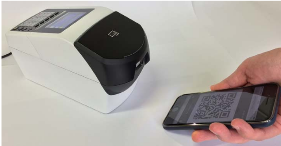
QRコードの読み取り