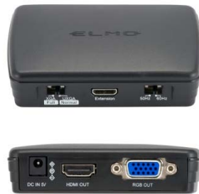
CONNECT BOX (セットモデル付属)

学校教育のICT化が進むなか、書画カメラ(実物投影機)は教室に定番のICT機器として幅広く認知され、世界的に普及が進んでいます。その大きな理由の一つが、書画カメラが教科書などの紙媒体や模型などの実物教材とPCやネットワークを介したデジタル教材を橋渡しする役割を持ち、操作が簡単で子供たちにわかりやすい授業を行うために便利な道具というところにあります。