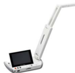
書画カメラ（MA-1）に搭載