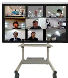
電子黒板（xSync Board／ELMO Board）に搭載