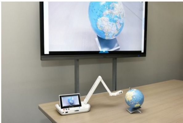
ワイヤレスでモニターに接続

※1 Miracast(ミラキャスト)とは、Wi-Fi Alliance によって策定された、1対1の無線通信によるディスプレイ伝送技術のことです。