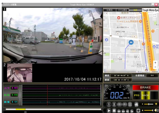
[2ch記録時の再生画面]

オプションカメラ入力(NTSC 信号)を備えており、オプションカメラのほか、バックカメラ等の映像信号を入力することが可能です。ドライバーや荷室の状況や車両後方の状況を記録することが出来ます。