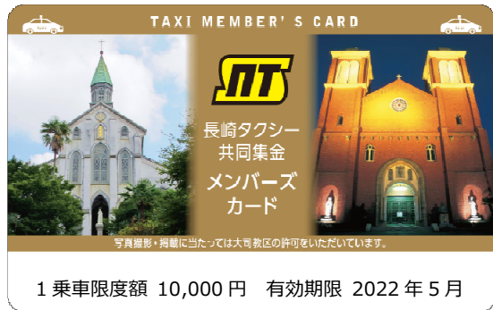
[メンバーズカード]