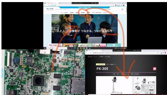
各端末の分割表示画面への 書き込みも可能