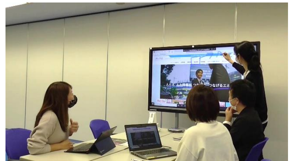
プレゼンテーションシーン