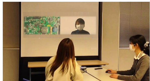
パソコンレスで遠隔会議