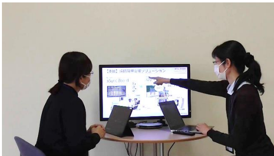
ミーティングスペースにも設置可能