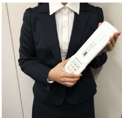
折り畳み時のコンパクトボディ