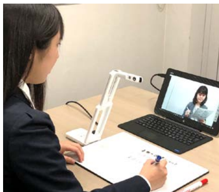
マルチコミュニケーションボードを連携した遠隔授業(イメージ)