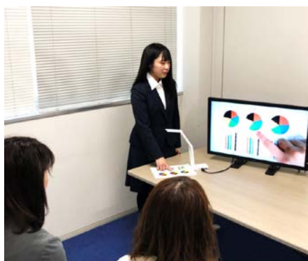
実物の教材や資料を指で示しながら説明