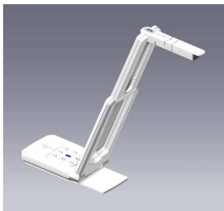
MX-P 本体(使用時のアームを伸ばした状態)