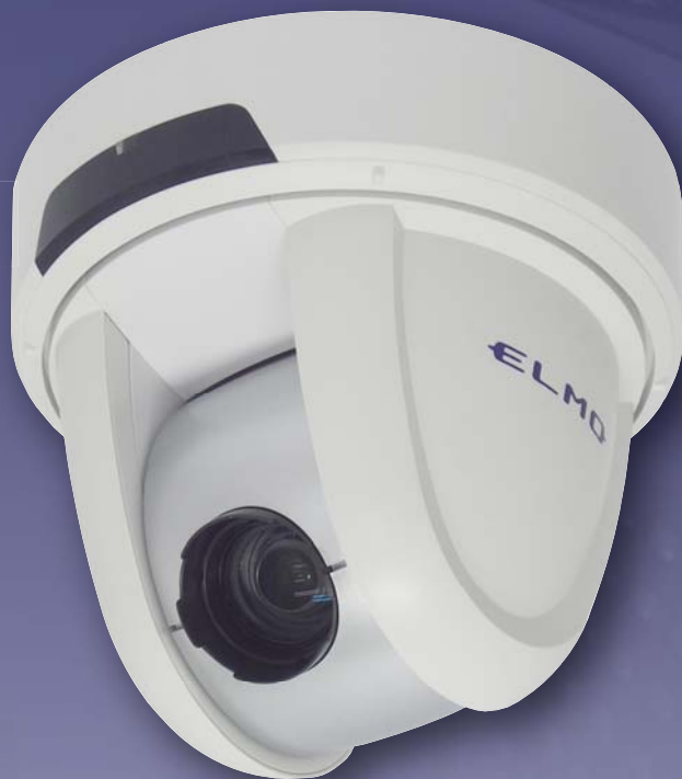
パンチルトズーム・HD-SDI カメラ PTC-400HD オープン価格

注) 非圧縮伝送方式と圧縮映像伝送 (VC-2) に対応。圧縮映像伝送で、最大 300 メートルまで。別売の多重伝送ユニット「HDS-VP40」が必要。