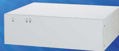
HDD増設ユニット HD-2TB (オプション)