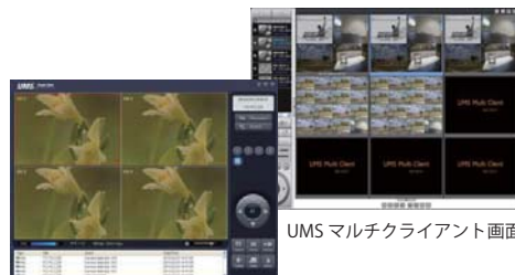
UMS マルチクライアント画面

付属のクライアントソフトやInternet Explorerブラウザで遠隔地からライブ映像の監視、PTZカメラ及びレコーダー操作・設定が可能。また、iPhone、Android対応スマートフォンで外出先からライブ映像を監視することができます。