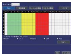
スケジュール録画設定画面

録画モードは、常時/モーション/センサー入力/スケジュール/手動の5モードを用意。用途に応じた録画設定が可能です。