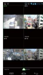
スマートフォン画面