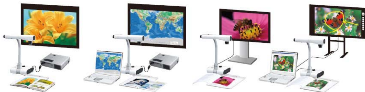
●プロジェクターで投影