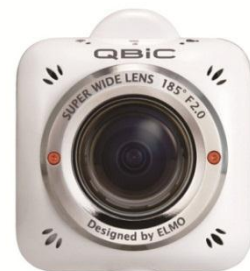
QBiC MS-1 (販売中)

QBiC Panorama は、最大画角 185° の超広角レンズを搭載した QBiC MS-1(キュービック エムエスワン) 4 台を専用リグ(取付部品)に取り付け、簡単に上下 180° 左右 360° のパノラマ動画を撮影する業務用カメラシステムです。